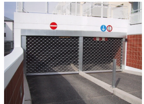
Neue Generation von Rollgittern: Das MRTG PLUS von Meißner

Und ausserdem spart das MRTG PLUS wirkungsvoll rund 80% des bisherigen Energiebedarfs einer solchen Toranlage ein. Einmalig.