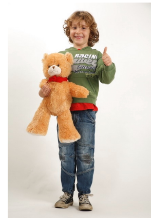
GARANTIERT KINDERSICHER Meißner sagt Unfällen erneut den Kampf an.

Es ist hinlänglich bekannt, dass auch heute noch immer Tore eingebaut sind und werden, die nicht den maximalen Unfallschutz bieten. So kommt es leider noch immer zu teilweise tragischen Vorfällen an Toren, oft sind spielende Kinder betroffen. Diesem Umstand hat man bei Meißner schon vor Jahren den Kampf angesagt und alle Anlagen unter dem Aspekt der maximalen Sicherheit optimiert. Bereits im Jahr 2000, d.h. etwa 5 Jahre vor Inkrafttreten der Tornorm DIN EN-13241 konnte Meißner für die Produktreihe der Tiefgaragentore eine TÜV-Baumusterprüfung vorweisen. Schon damals lancierte die Fachwelt die Schlagzeile „Die sichersten Rolltore kommen von Meißner“.